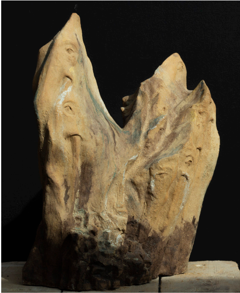
Massif Terre cuite : Grès, engobes et oxydes en monocuisson 2024 44.5x48x27 cm