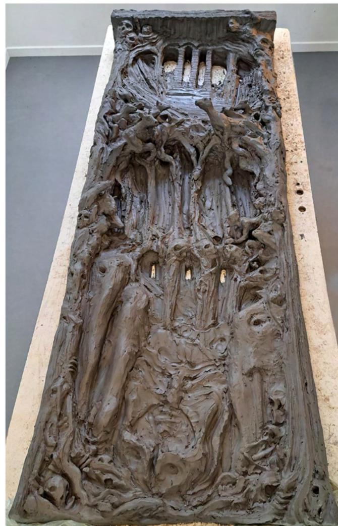
Porte Sousterraine Argile crue 180cm x 70 cm 2026 oeuvre en cours