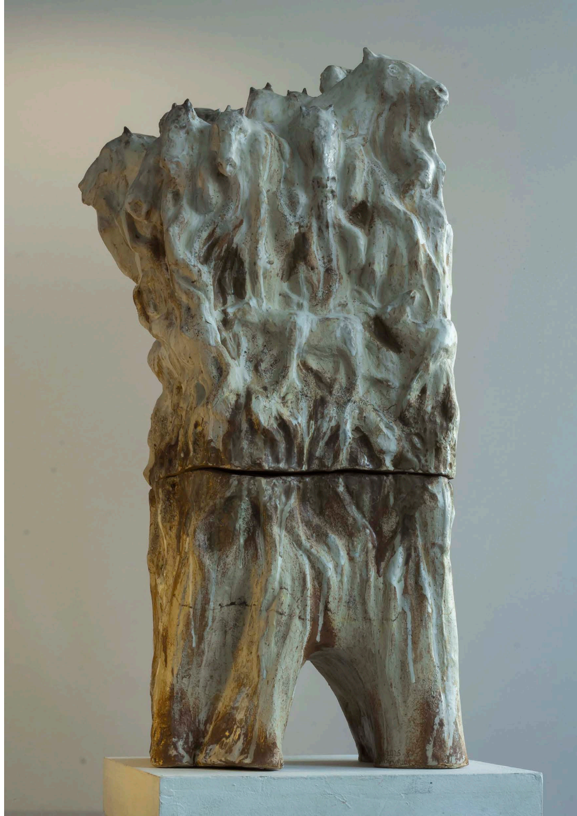
Hypsodonte Terre cuite, Grès, engobes, émaux 34 x 28 x 81 cm 2025