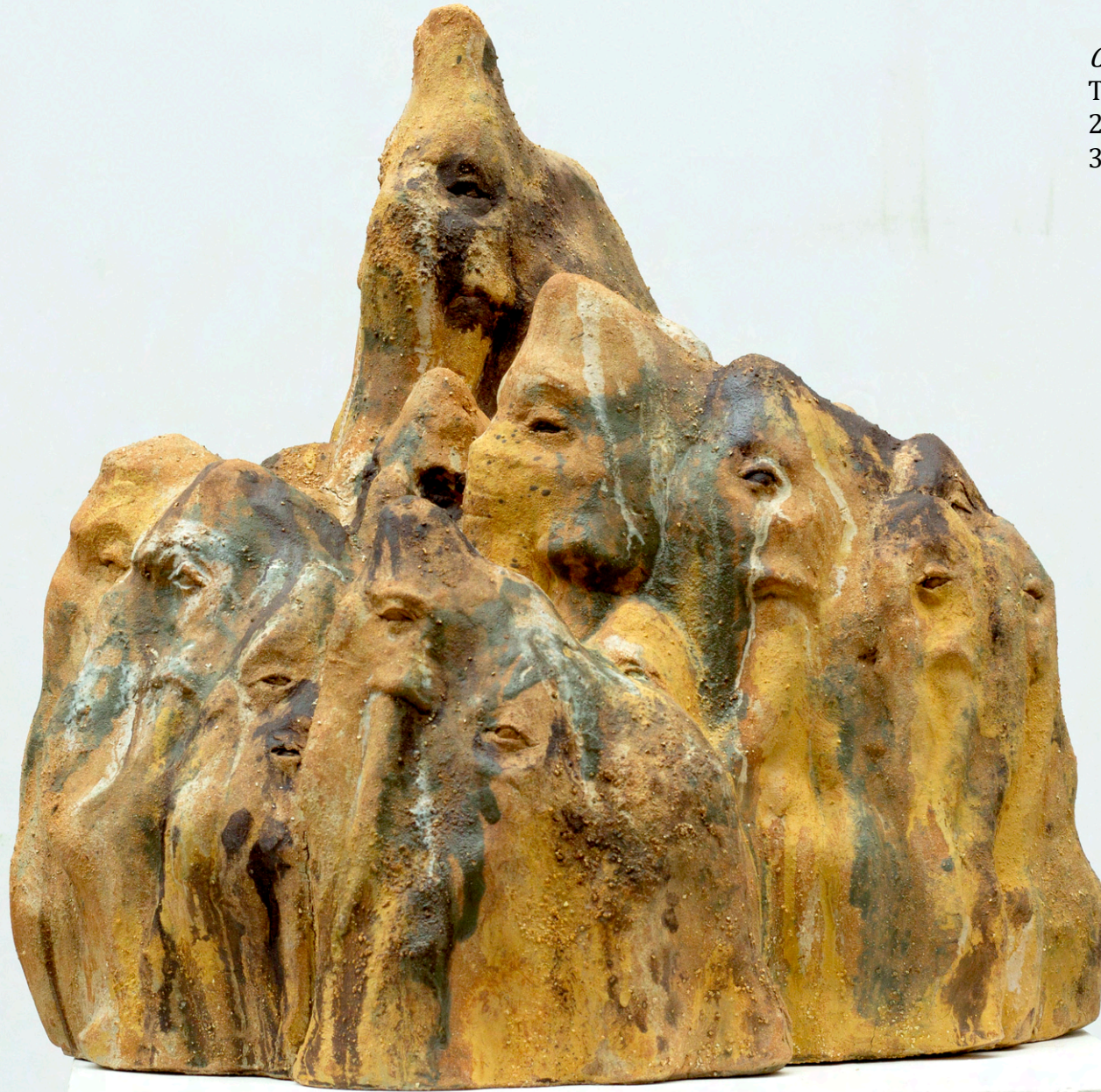
Cimes Terre cuite, grès. engobes 2023 38.5x40x32 cm