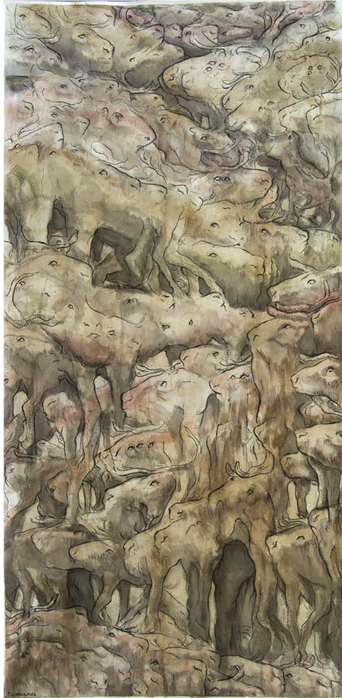
Stratigraphie du renne Encre de chine, aquarelle, brou de noix et fusain sur papier 2023 150x75 cm

Les couches de rennes superposées sont les strates archéologiques, à l'images de celles où les chercheurs ont découvert un nombre fabuleux de représentations de ces grands troupeaux.