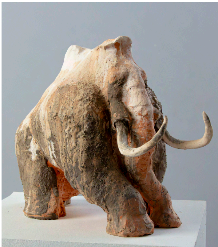
Mammoth ensablé Terre cuite, faïence et engobes 2022, 31x15x24 cm